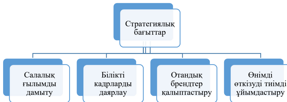
2-сурет. Жеңіл өнеркәсіпті дамытудың стратегиялық бағыттары

Еліміздің жеңіл өнеркәсібінің өнімдері әлемдік нарықта емес, отандық ішкі нарықта да шетелдік бәсекелестерде төтеп бере алмай отыр. Сол себепті жеңіл өнеркәсіптің даму стратегиясы 4 бағыттарды қамту керек (2-сурет).