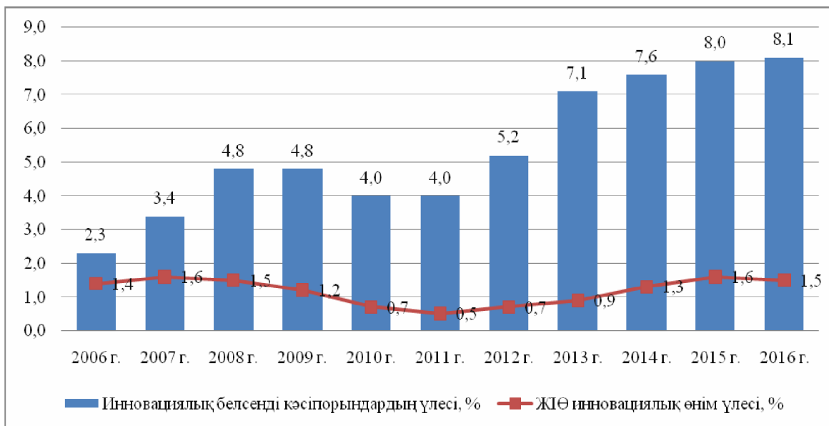
1-сурет. ЖІӨ құрамындағы инновациялық өнім үлесінің қарқыны *

масында бекітілген. Жалпы қабылданған шаралардың арқасында елдің инновациялық саласындағы негізгі көрсеткіштерін атауға болады (1-сурет).