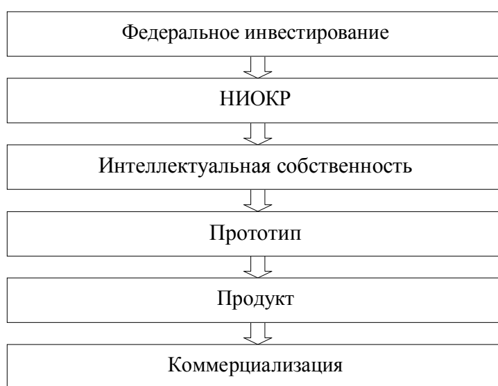
Рис. 1. Стимулирование процесса трансферта технологий в США

пах: инвестирование, НИОКР, создание интеллектуальной собственности (рис. 1). На последующих этапах правительство передает права университетам, исследовательским организациям, частным фирмам.