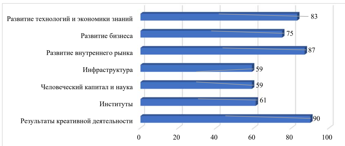
Рисунок 1. Показатели рейтинга ГИ в 2023 г.*

* Составлен авторами на основе источника [8]