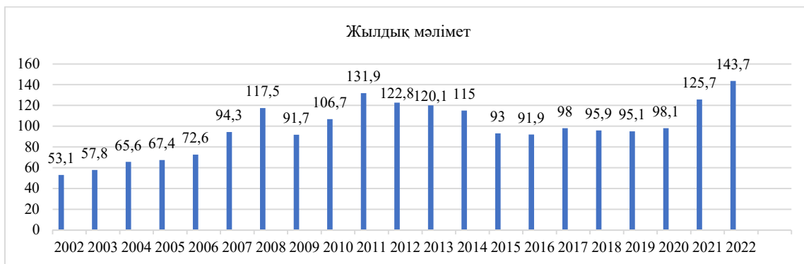
2-сурет. Азық-түлік және ауыл шаруашылығы ұйымы (ФАО) азық-түлік бағасының индексі, 2002-2022 жылдық мәлімет* * ФАО мәліметтері негізінде авторлармен құрастырылған

2022 жылдың желтоқсанында негізгі азық-түлік санаттарының ішіндегі ең үлкен көрсеткіш дәнді дақылдар бойынша тіркелді: 147,3 тармақ. Өсімдік майы бағасының индексі қараша айынан бастап 10,3 тармаққа, 2021 жылғы желтоқсанмен салыстырғанда 34,1 тармаққа төмен түсіп, 144,4 тармаққа жеткен. Сүт өнімдерінің баға индексі 139,1 тармақты құрады, бұл 2021 жылғы желтоқсанмен салыстырғанда 10,1 пунктке жоғары, қараша айындағы көрсеткіштен 1,5 тармаққа жоғары көрсеткіш. Қант бағасының индексі 2022 жылғы желтоқсанда 117,2 тармақты құрады, бұл қарашада айындағы көрсеткіштен 2,8 тармаққа және 2021 жылғы желтоқсаннан 0,7 тармаққа жоғары. Ет бағасының индексі 113,8 тармақты құрады, қараша айында 1,4 тармаққа төмендеді, алайда 2021 жылдың желтоқсан айына қарағанда 2,8 тармаққа жоғары.