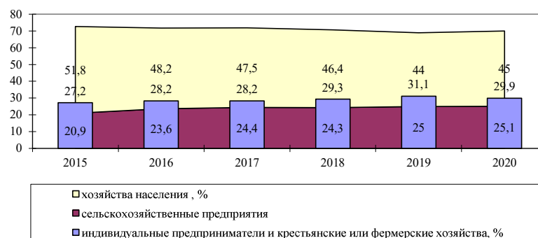
Рисунок 3. Выпуск продукции по категориям хозяйств за 2015-2020 годы, %*

Значительная доля в валовом выпуске продукции (услуг) сельского хозяйства принадлежит в среднем хозяйствам населения – 47,2%, хотя в 2020 году мы наблюдаем снижение ее доли в сравнении с 2015 годом на 6,8%. Происходит также рост доли продукции сельскохозяйственных предприятий с 20,9% до 25,1 и индивидуальных предпринимателей (крестьянских или фермерских хозяйств) с 27,2% до 30% (рисунок 3).