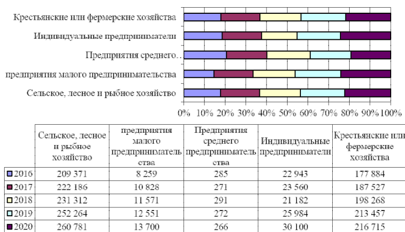
Рисунок 4. Действующие субъекты МСП в сельском хозяйстве, ед.*

матели, 5,3% - предприятия малого предпринимательства. За анализируемый период сохраняется тренд роста действующих субъектов МСП в сельском хозяйстве на 24,6% или 51 тыс. ед., крестьянских фермерских хозяйств на 21,8% или 38,8 ед., индивидуальных предпринимателей на 31,2% или 7,2 тыс. ед. и предприятий малого и среднего предпринимательства на 63,5% или 5,4 тыс. ед.