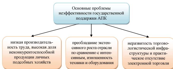
Рисунок 5. Основные проблемы неэффективности государственной поддержки АПК*

Снижение доли сельского хозяйства в ВВП страны почти в 2,3 раза с 12,3% до 5,3% в 2020 году обусловлена проблемами отрасли, отраженными на рисунке 5.