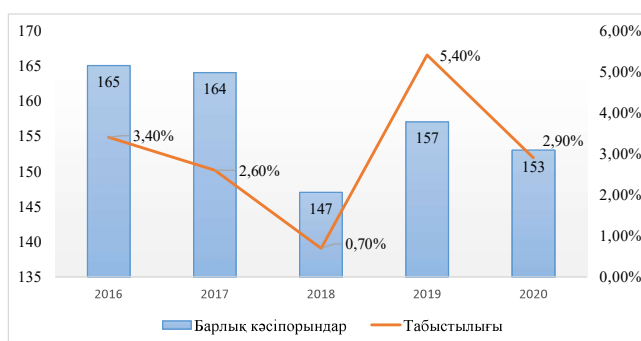
1-сурет. Қазақстан Республикасында тоқыма бұйымдарын шығаратын кәсіпорындардың өзгерісі*

Салық салуға дейінгі пайданың аз мөлшері өз кезегінде табыстылық деңгейінің төмендеуіне алып келді (1-сур.).