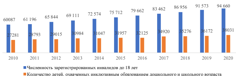
Рисунок 1. Показатели, характеризующие уровень инклюзивного образования в Казахстане за период с 2010-2020 годы, человек*

* Составлен на основе изучения источника [6]