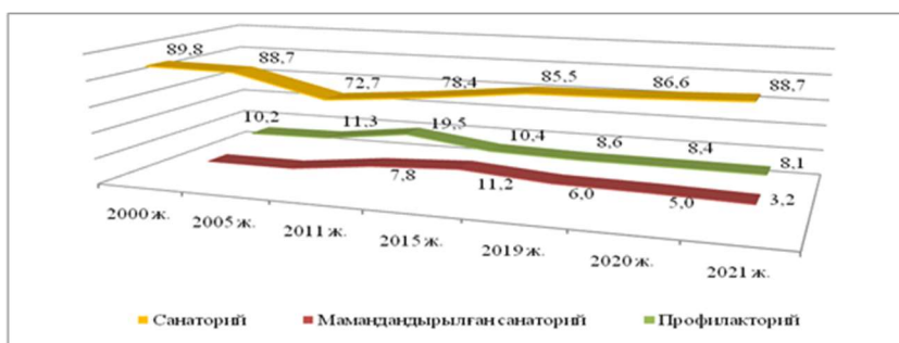
3-сурет. Медициналық санаторлық туризмнің провайдерлері бойынша көрсеткіштер, бірлік*

Санаторийлер негізінен Түркістан облысында шоғырланған. Бұл облыста санаторийлердің жартысынан көбі жұмыс жасауда. Олардың саны 2021 жылы 58-ге жеткен болатын.