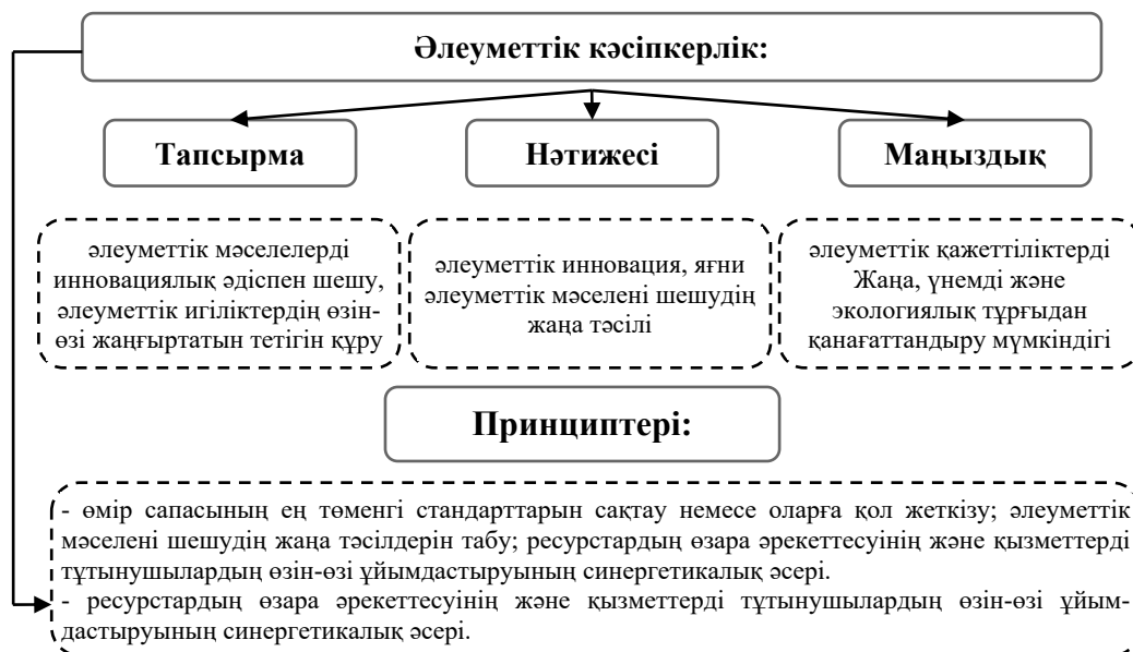
1-сурет. Әлеуметтік кәсіпкерліктің теориялық және практикалық мәні*

* [4] дереккөзі негізінде авторлармен құрастырылған