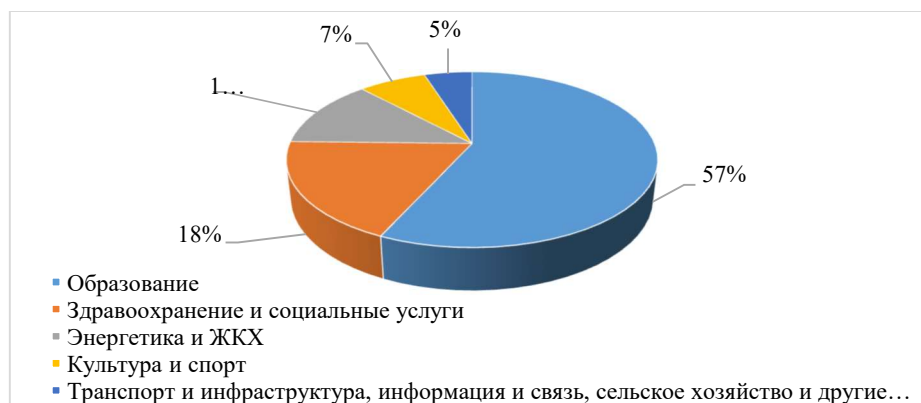
Рисунок 3. ГЧП проекты по отраслям в Республики Казахстан на 01.09.2022 года*

Анализ отраслевой структуры ГЧП свидетельствует, что сегодня в Казахстане доминируют 3 сферы: образование, на которую приходится 57% от общего количества проектов, здравоохранение - 18%, энергетика и ЖКХ - 13% (рисунок 3).