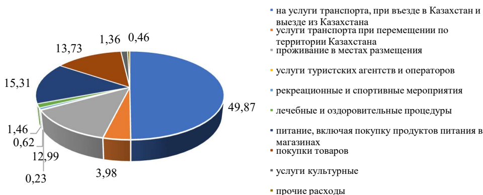
Рисунок 2. Удельный вес расходов въездных посетителей в разрезе статей расходов в 2022 году, %*

Стоимость проживания в местах размещения с более высоким качеством оказываемых услуг намного выше, по сравнению с ценами в аналогичных местах размещения ведущих туристических стран. Высокие цены на услуги мест размещения связаны с низкой заполняемостью, недостатком конкуренции и сильной зависимостью от бизнес-туристов. Услуги, предлагаемые отечественными туристическими объектами, имеют ограниченный сервис и слабо регулируются. Именно высокая стоимость услуг мест размещения и высокие цены на авиабилеты влияют на высокую стоимость тура в Казахстан, что отрицательно сказывается и на показателях въездного туризма, и на конкурентоспособности нашей страны на мировом туристическом рынке. На рисунке 2 показаны основные расходы въездных посетителей в разрезе расходов.