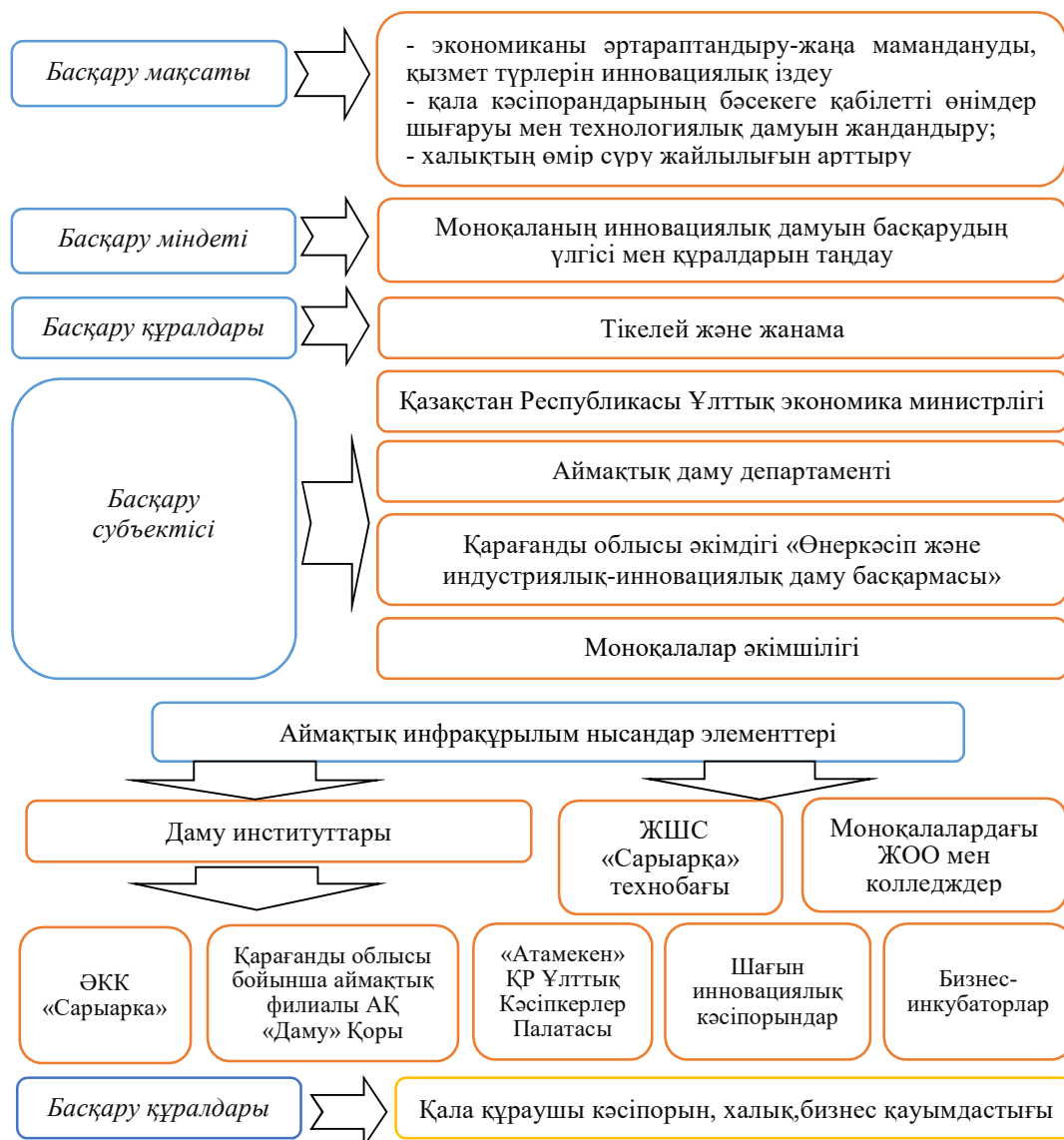
2-сурет. Қарағанды облысы моноқалаларының инновациялық дамуын басқару моделі

Қарағанды облысы моноқалаларының инновациялық дамуын басқару үлгісі төменгі суретте көрсетілген.