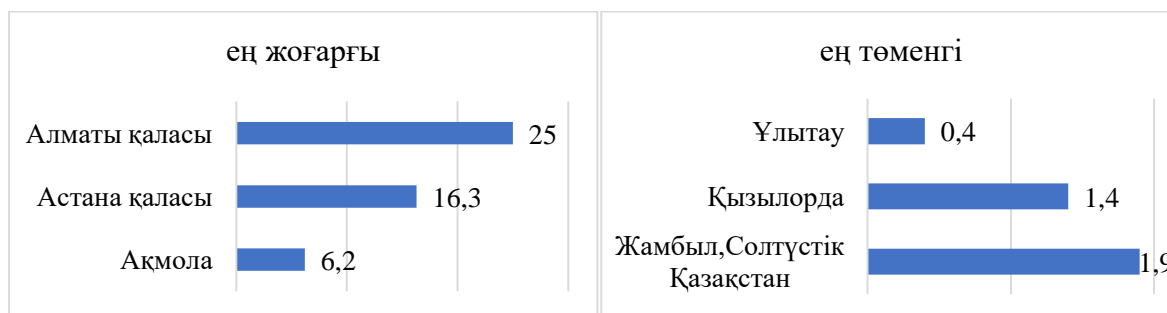
Сурет 1. 2023 жылы Қазақстан өңірлеріндегі туристерді қабылдаудағы ең жоғары және төменгі үштікке ие өңірлер, %*

Қазақстан өңірлеріндегі туристерге орналастыру орындарымен қызмет көрсетуде жоғары үлесті Алматы қаласы алып отыр. Алматы қаласы 2023 жылы 2022 жылмен салыстырғанда 12,4 пайызға артқан. Жалпы Қазақстан бойынша қызмет көрсетілгендер саны 2022 жылмен салыстырғанда 2023 жылы 804108 адамға артық орындалған, яғни 10,9 пайызға 2023 жылы 2022 жылмен салыстырғанда қызмет көрсетудегі тұтынған туристер саны артып отыр. Оның ішінде Батыс Қазақстан ерекше атап өтуге болады, қызмет көрсетілген адам саны 2022 жылмен салыстырғанда 64,5 пайызға артқан. Ең аз қызмет көрсетудегі туристердің сандық көрсеткішінде аз орындалған өңірлерге Ұлытау, Қызылорда, Жамбыл және Солтүстік Қазақстан облыстарын атап өтуге болады. Туристер санын қабылдауда алдыңғы қатарлы үштікті атап өтетін болсақ, онда: Алматы қаласы, Астана қаласы мен Ақмола облысы жоғарғы көрсеткішке ие болып отыр.